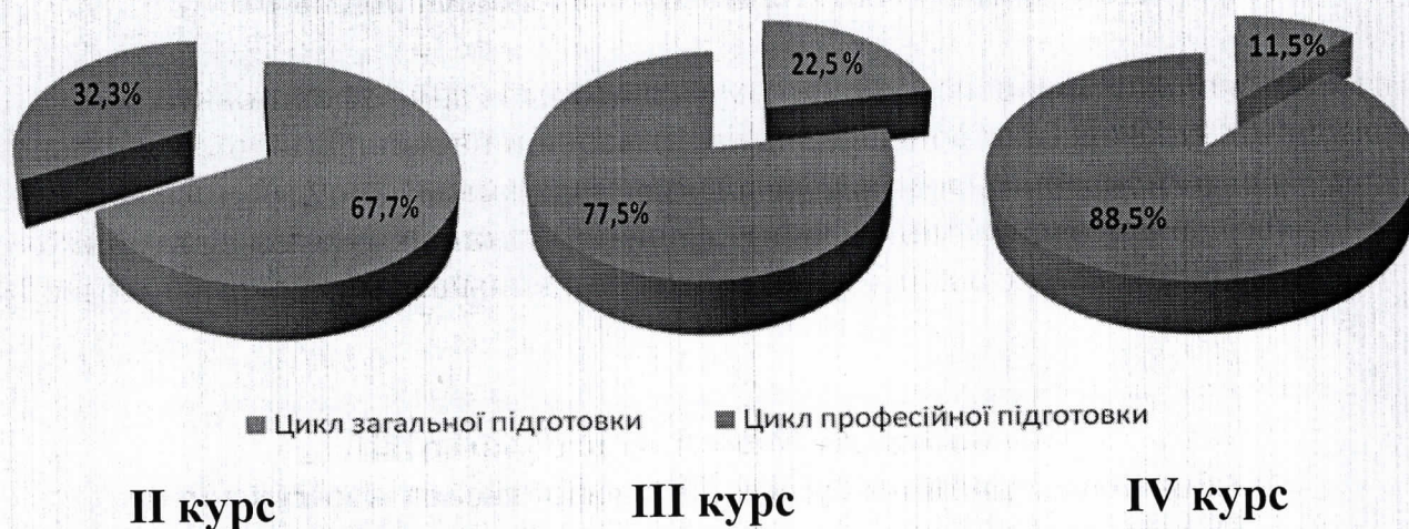
Діаграма розподілу освітніх компонент в рамках освітньо-професійної програми початкового рівня (короткий цикл) вищої освіти підготовки молодшого спеціаліста зі спеціальності 223 Медсестринство спеціалізація Акушерська справа

Освітньо-професійна підготовки молодших спеціалістів початкового (короткий цикл) рівня вищої освіти зі спеціальності 223 Медсестринство спеціалізації Акушерська справа передбачає диференційоване розподілення компонентів двох циклів: загальної та професійної підготовки освітньої програми по курсах навчання в залежності від кількості кредитів ECTS.